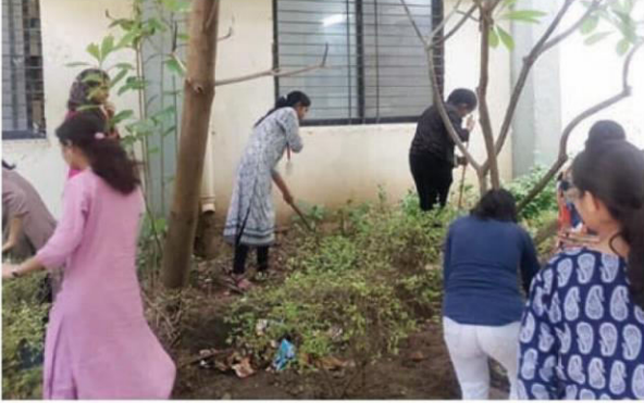
Latur Edition Sep 29, 2025 Page No. 3 Powered by: erelego.com