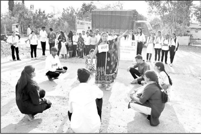
दावतपूर येथे सुरू असलेल्या राष्ट्रीय सेवा योजना शिबिरात ग्रामस्थांमध्ये पर्यावरण संरक्षणासंदर्भात पथनाट्य सादर करण्यात आले.