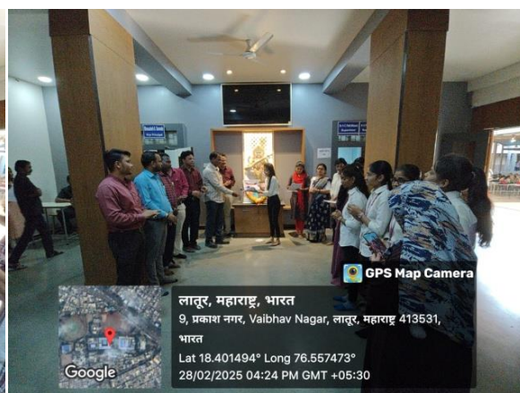
III rd Prize