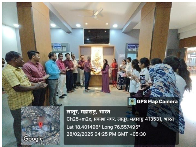
I st Prize