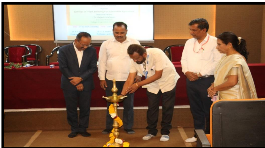
One Day Seminar on "Plant breeding for sustainable Agriculture"