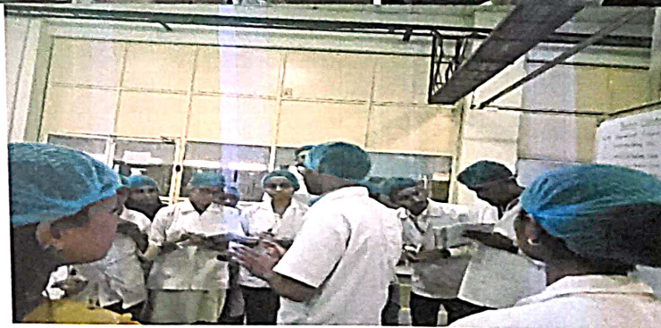
Students Understanding the working of Industry