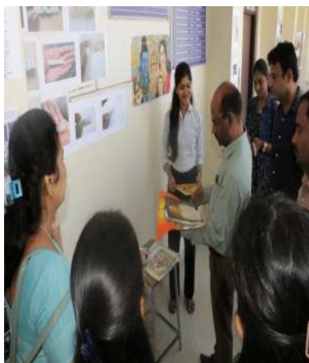
Painting/Sketches/Art & Craft Exhibition