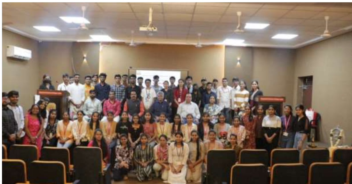
Participants of the Workshop with the dignitaries