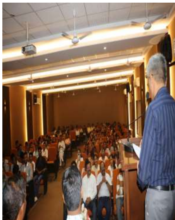
Presidential address by Hon. Joint Secretary of DES Shri Vishal Lahoti.