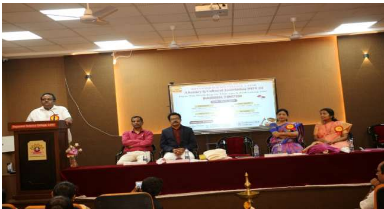
President of the programme Hon. Ajinkya Sonwane delivering presidential address