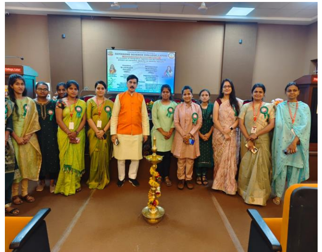
Lighting of lamp