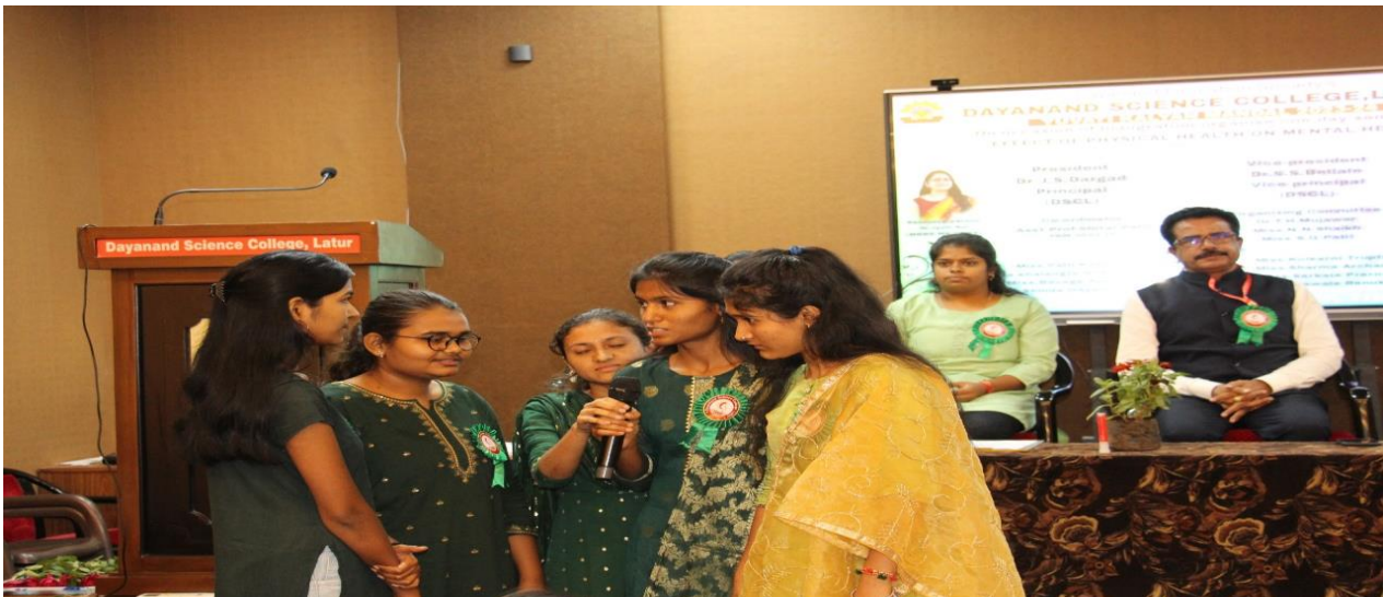
Skit by YKM girls