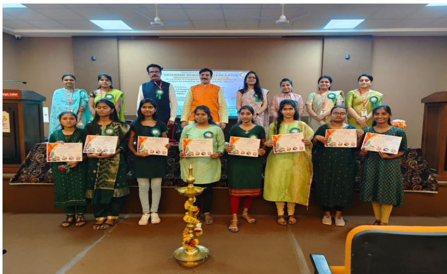
Distribution of certificate for YKM Members