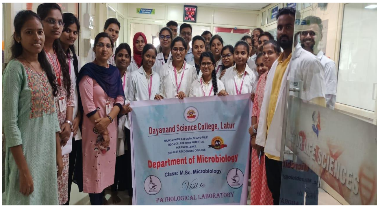
M.Sc. Microbiology Students