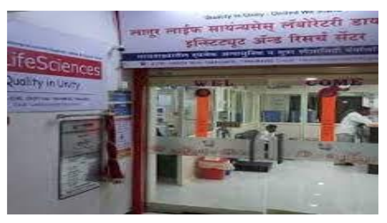
LLB Pathological Laboratory