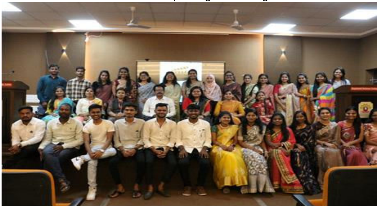
M.Sc Second year students