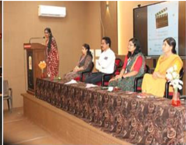
Second Year Students expressing their thoughts on Farewell