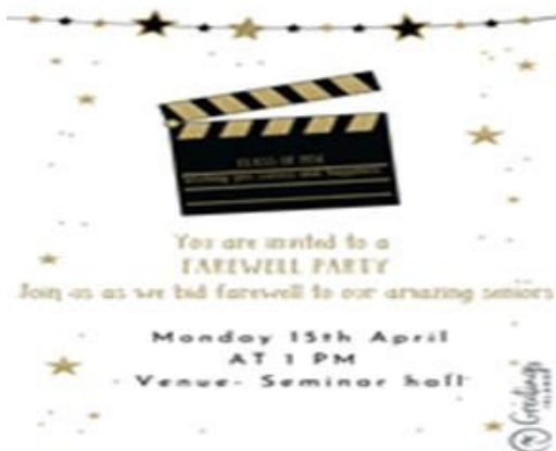
Introductory Speech on Farewell