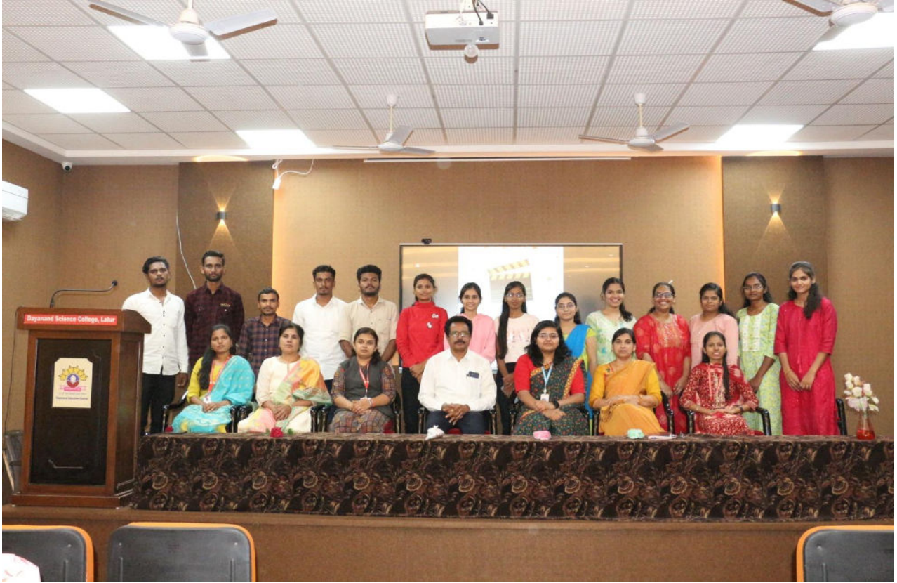
M.Sc First Year Students

Event organized during The Academic Year 23-24