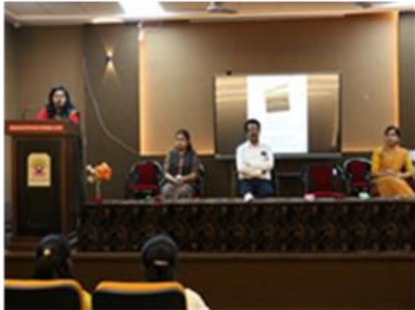
Presidential Speech on Farewell