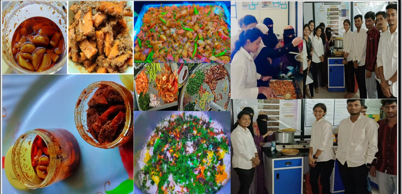
Day 4: Different types of Pickles.