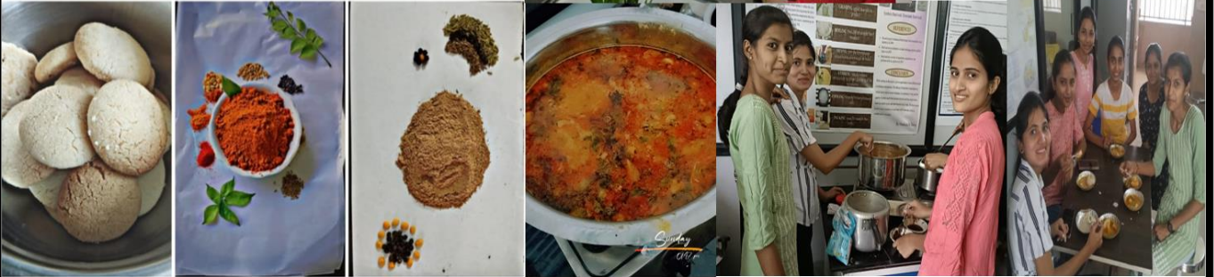
Day 1 Healthy Biscuits