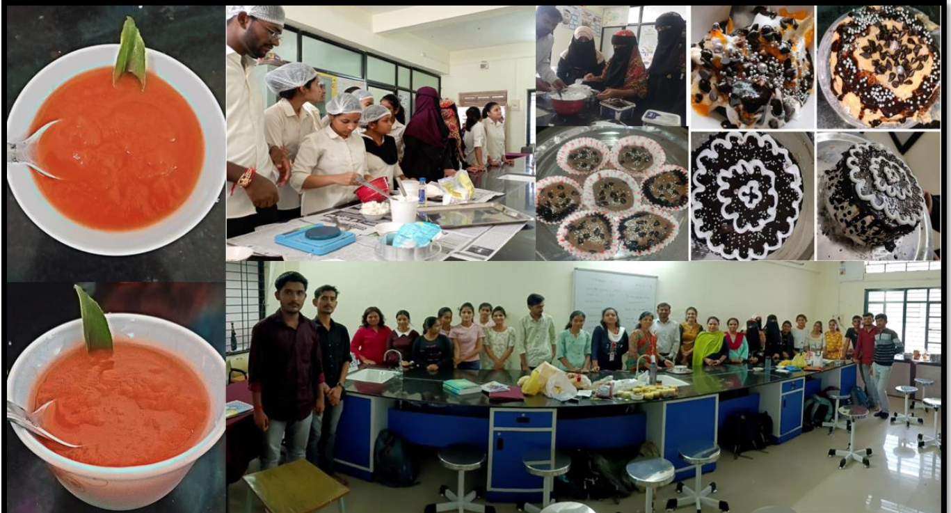
Day 6: Instant tomato Soup & cupcake