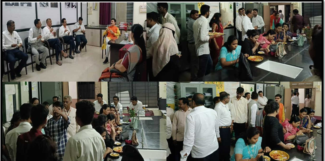
Sensory evaluation of Veg. Biryani by Hon. Principal Sir & teaching staff on the occasion of Teachers Day.