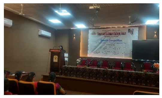
Winners in Speech Competition