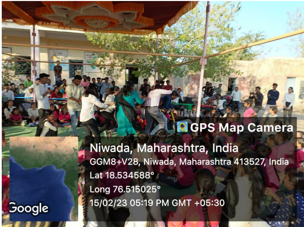
Science Association committee members performing a Drama on 'Antisuperstition' at Dayanand NSS camp at Nivada Village