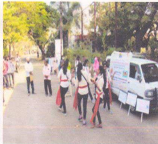
In front of Dayanand Science College