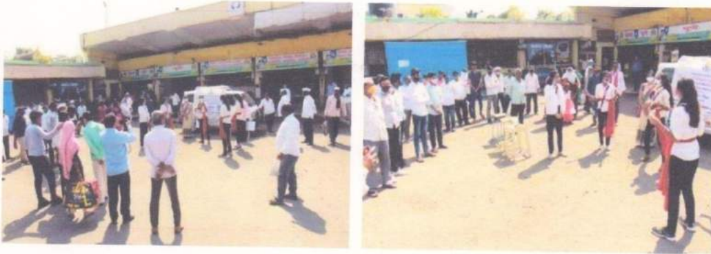
Latur City Bus stand