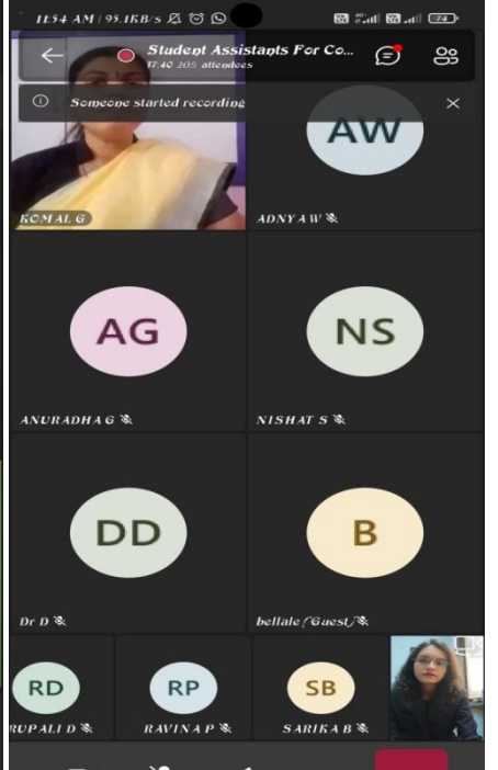
Virtual Event Flyer and Photographs