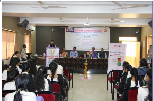
Participant students at the workshop