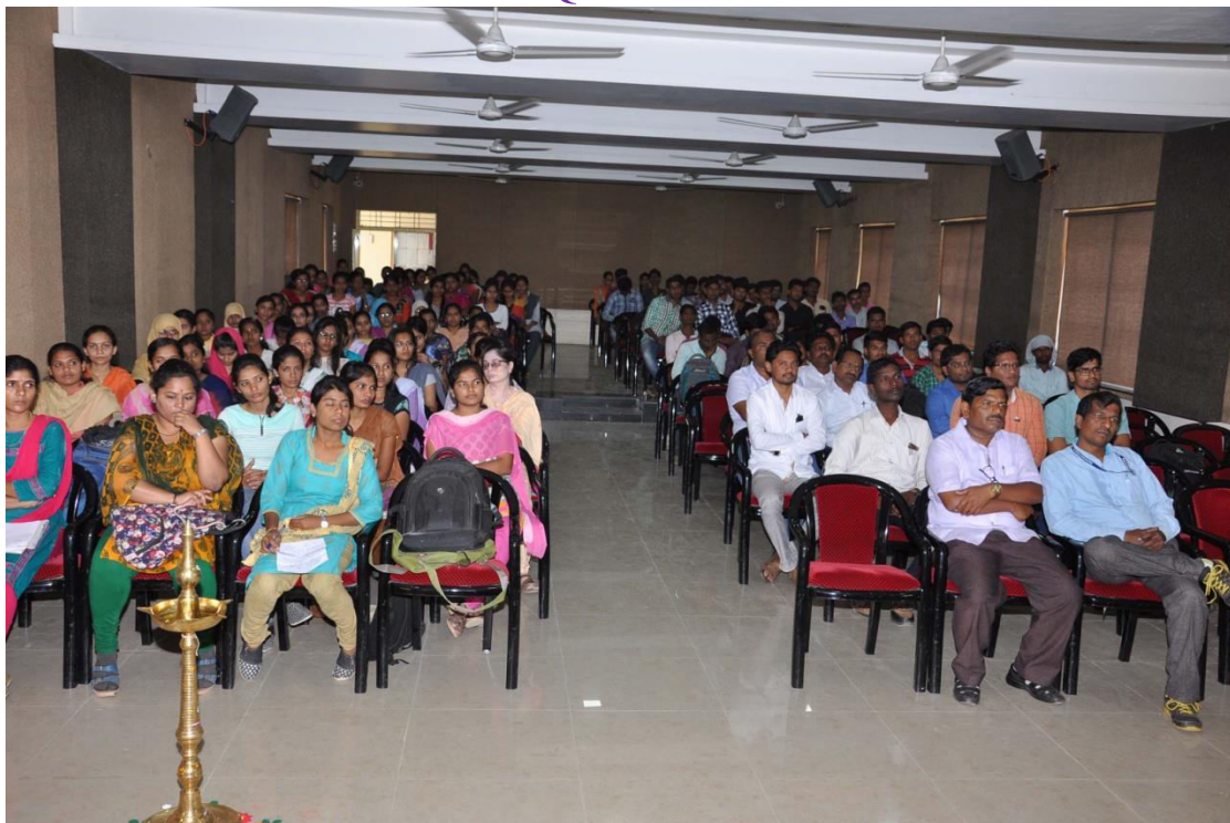
113 participants actively participating in the workshop