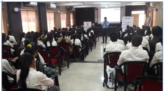
Students responding the speaker in Question-Answer session