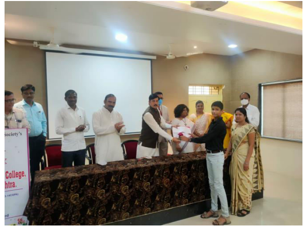
Prize distribution of “Online Debate Competition program” organized by Bhartiya Shikshan Mandal, Latur in Dayanand Science College, Seminar hall