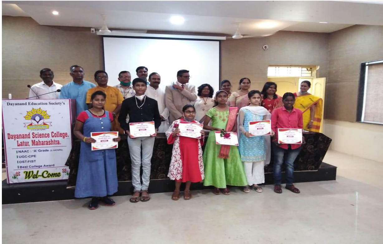
Prize distribution of “Online Debate Competition program” organized by Bhartiya Shikshan Mandal, Latur in Dayanand Science College, Seminar hall