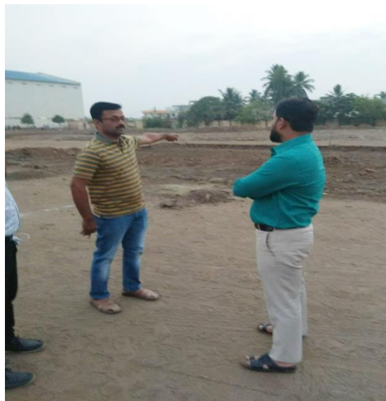
3. Sendoff and welcome function of collector by Dayanand Education society, Latur 15.12.2020