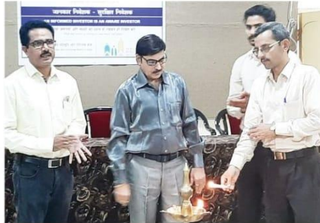
फसवणूक होऊ नये म्हणून सर्वांनी जागरूक रहावे, असे प्रतिपादन प्रा. डॉ. दयानंद विज्ञान महाविद्यालय व

सध्याचे युग जागतिकीकरणचे आहे. या युगात शिक्षकेत्तर कर्मचाऱ्यांसारख्या मध्यमवर्गीय लोकांनी जागरूक होऊन भावी काळासाठी पैशाची योग्य गुंतवणूक केली पाहिजे. संकटसमयी पैशाची उणीव भासते म्हणून पैशाची वचत केली पाहिजे. यासाठी केंद्र सरकारच्या जाहिराती, श-अर मार्केट, वित्तीय नियोजन, पैशाचे व्यवस्थापन यासंदर्भात प्रशिक्षण, माहिती मिळविली पाहिजे. भावनिक होऊन आर्थिक निर्णय न घेता वस्तुनिष्ठपणे त्याचा विचार केला पाहिजे. कमी वेळेत जास्त फायदा या प्रलोभनाला बळी न पडता जागरूक झाले पाहिजे. वचत व गुंतवणूक यांच्यातील फरक समजून घेऊन स्वतःच्या पैशाचे व्यवस्थापन करायला शिकले पाहिजे. पैशासंदर्भात इतरांकडून