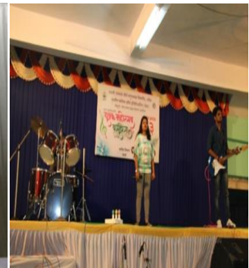
Student performing Classical Vocal solo Student Performing Elocution Western Vocal (Solo)