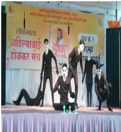
Student performing Mime.