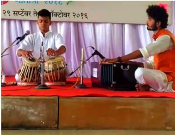
Student performing Classical Instrumental solo.