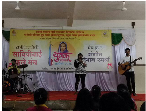
Student performing Western solo.