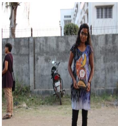
Students received Prize in Debate Competition.