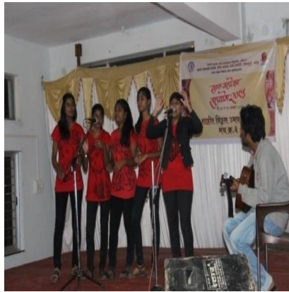
Students performing Western Group.