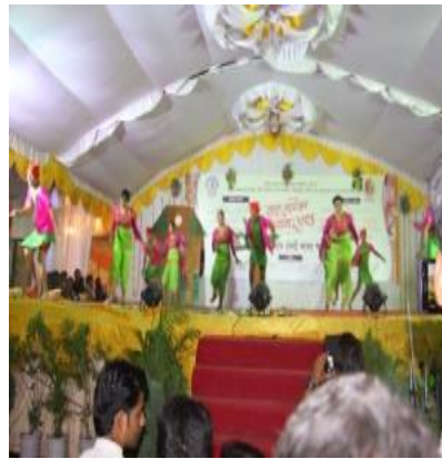
Students performing Dance.