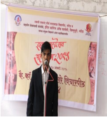
Student performing Mimicry. Western Solo.