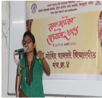
Student performing Debate.